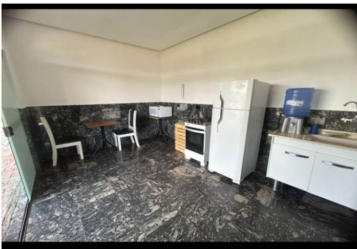
Situação: Depois da Reforma

Descrição: Ambiente improvisado, com mobiliário antigo e em más condições. Pia e fogão desgastados, uso de botijão de gás exposto, ausência de ventilação ou exaustão adequada. Estrutura sem organização e higiene compatíveis com uma área de apoio funcional. O espaço era limitado, com utensílios e móveis domésticos reutilizados, comprometendo a segurança e a eficiência no suporte às famílias e equipes.