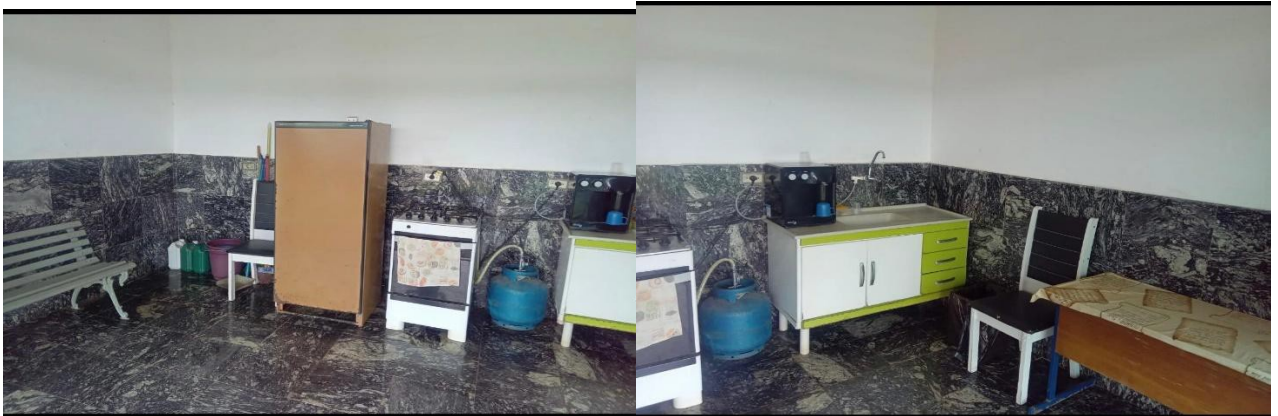
Situação: Antes da Reforma

CONSORCIO XV DE NOVENBRO CNPJ: 52.270.606/0001-40