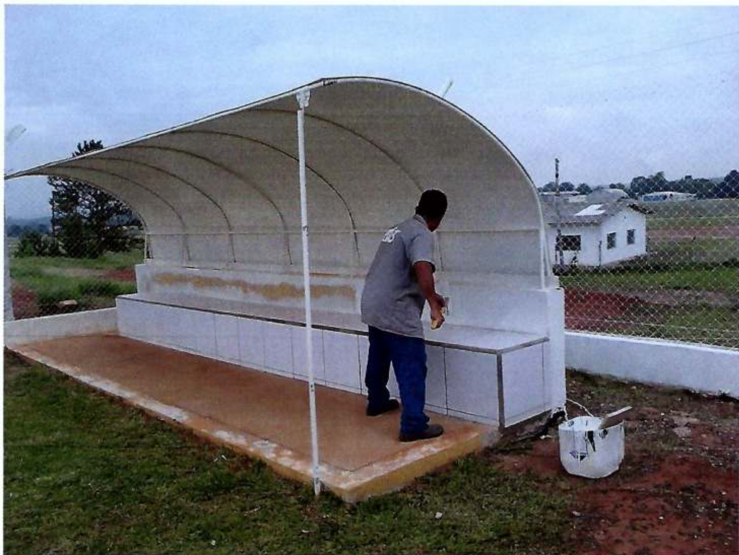
↳ BANCO DE RESERVA NO CAMPO DE FÚTEBOL COM COBERTURA,